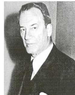
Juan Martínez Gutiérrez

En su proyecto para el Templo Votivo se manifiesta la originalidad y vigorosa personalidad de Juan Martínez y su profundo conocimiento de la arquitectura europea de los años 20 y 30. Algunos críticos reconocen especialmente la fuerza del expresionismo alemán en el Templo de Maipú. Desde 1943 en adelante el arquitecto Martínez modificó algunos aspectos del proyecto original, según lo atestiguan las maquetas y dibujos originales.